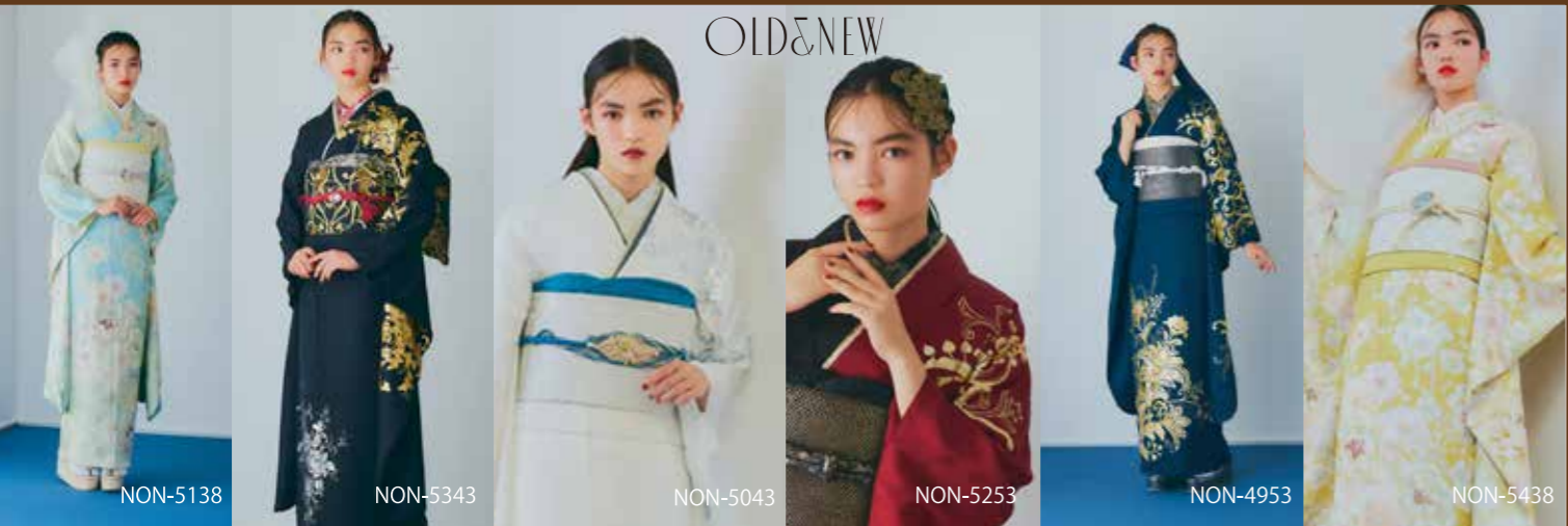
NON-5138 NON-5343 NON-5043 NON-5253 NON-4953 NON-5438

敢えて色数を抑えたモードな世界観が好評 ファッション性の高さに定評のあるオリジナルブランド第5弾