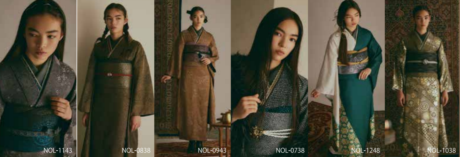
NOL-1143 NOL-0838 NOL-0943 NOL-0738 NOL-1248 NOL-1038

『留袖王に俺はなる!』 価格高騰&生産が懸念される留袖の 安定した供給と価格維持は 和装メーカーの使命。 西善オリジナル留袖ラインアップ。 ※掲載柄以外にも多数ございます。