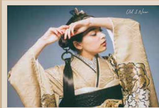
Old & New